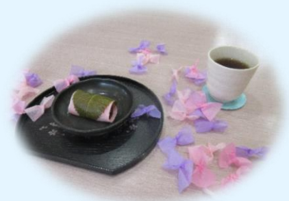
桜餅を食べながら花見