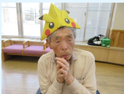
こどもの日には 子供に若返る